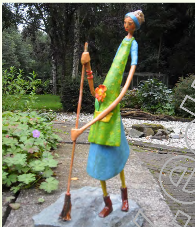
Assepoetster van Geri