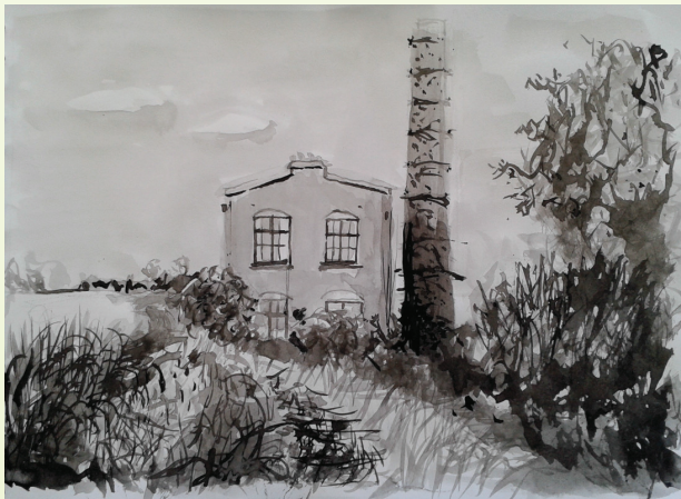
Kunst in de hal van het Gemeentehuis in Brummen