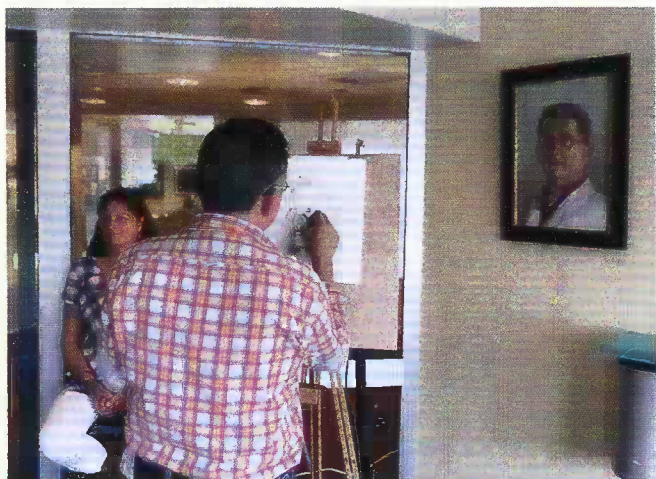
De hoed van Peer